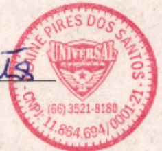
Elaine Pires dos Santos - ME P/ CONTRATADA