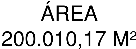
Formato A1 841x594mm